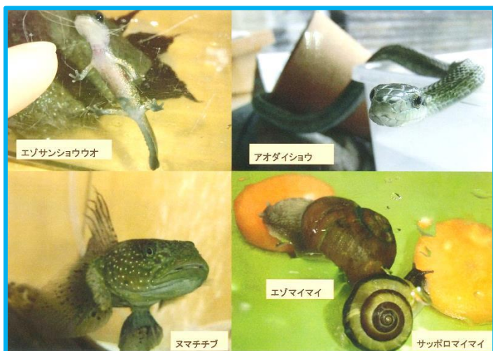
エソサンショウウオ