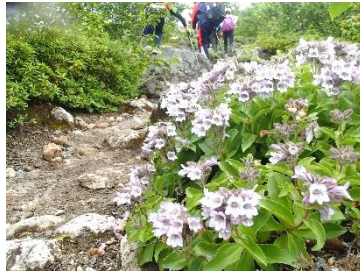
樽前山…イワブクロが見頃です