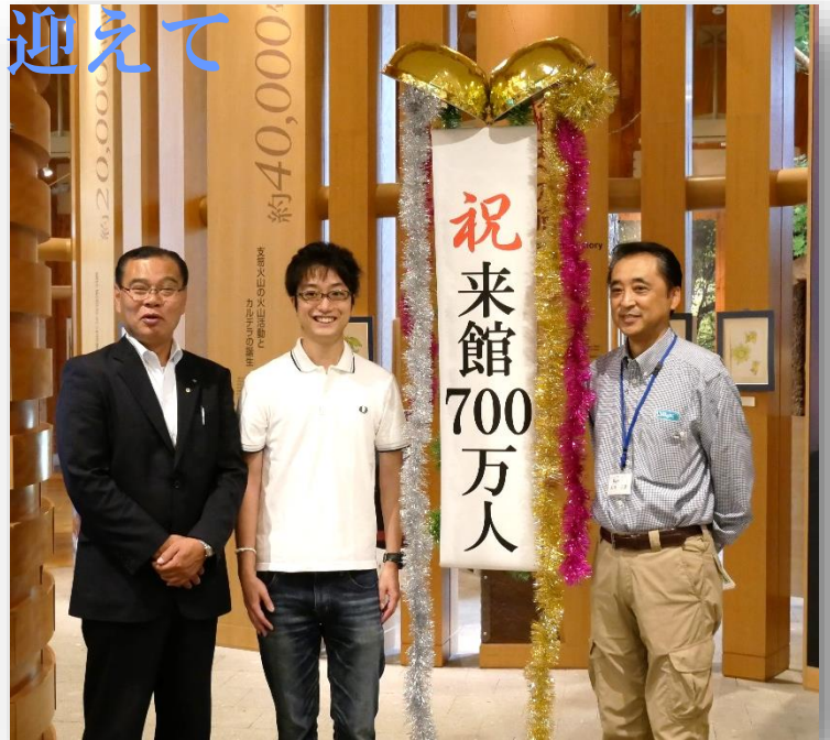
崩れた路肩とのり面が修復されました

ビジターセンターは今後も癒やしを求めていらっしゃる方をお迎えしていき、国立公園支笏湖の旬な情報をお伝えしていきます！