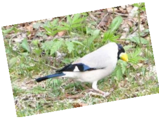
今年はイカルのさえずりがにぎやかに聞かれます