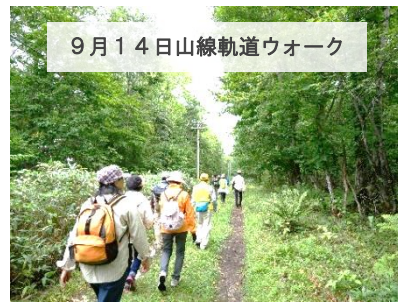
9月14日山線軌道ウォーク