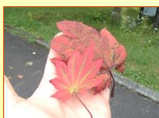
ハウチワカエデの紅葉