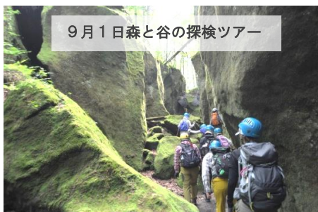
9月1日森と谷の探検ツアー