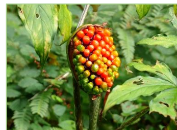
赤く色づき始めたコウライテンナンショウの実