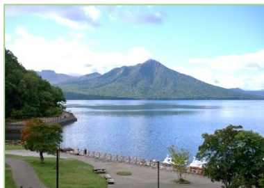
ビジターセンター近くからの景色