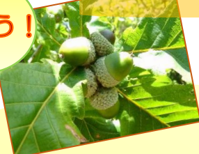
実ったばかりのミズナラの「どんぐり」