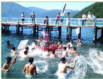
支笏湖神社祭りの様子 (9月10日)