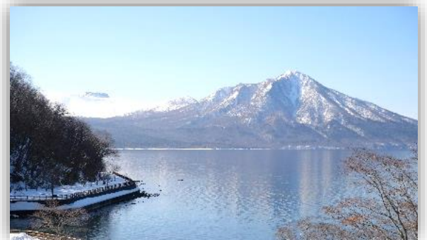
支笏湖温泉地区は鏡ではなく波穏やかな湖面