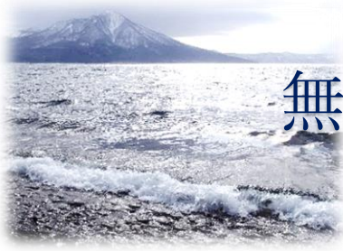
半鏡の前日 荒波の湖