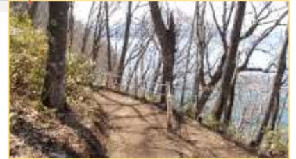
葉っぱが茂らない今、森は明 るい雰囲気です。

ビジターセンターから歩いて(途中坂道を登って)約15分の場所に「支笏湖・野鳥の森」があります。片道約1.6kmの遊歩道は土砂崩れなどの自然災害を受け、以前から利用できなくなっていました。森の入口エリアにあった約400mの遊歩道が再整備されました。遊歩道は歩きやすくなり、斜面側の柵も新調されました。