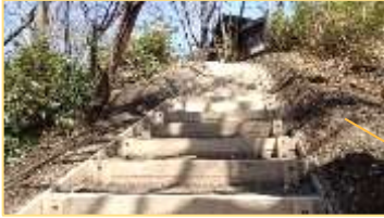
野鳥観察舎近くの階段