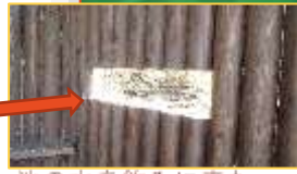
池の水を飲みに来た 野鳥を観察できます。