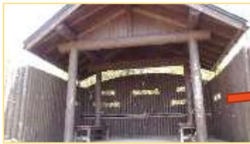
野鳥観察舎の観察窓から 池をのぞきます。