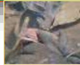
池にはエゾアカガエルが産卵 に来ていました(4月12日)