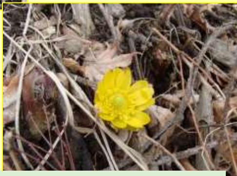
フクジュソウの開花や芽出し!