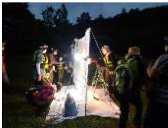
ライトトラップで虫観察