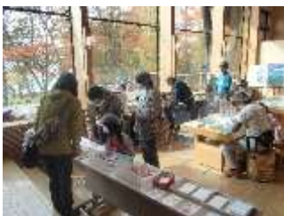
紅葉のもみじの押し葉ではがき作り