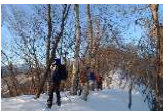
夕景を眺めながらの冬山登山