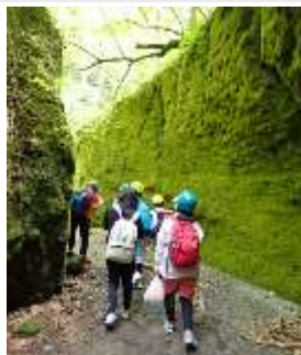
小学生対象「苔の回廊(楓沢)」探検