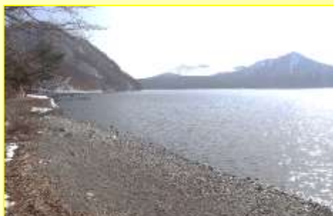
水位が下がった湖と山の雪景色!