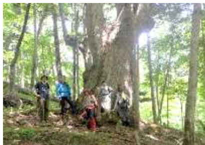
オコタン崎の巨樹を目指して森探検