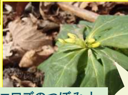
ナニワズのつぼみ!