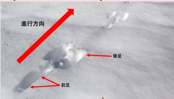
前脚とその前の後ろ脚がワンセット。後ろ脚で大きく跳ねて、前脚で着地します。この写真では、左下から右上へ進んでいます。

運よく出会えたとしても時速70km以上とも言われるその足の速さで、まさに『脱兎の如く』逃げられてしまうことでしょう。